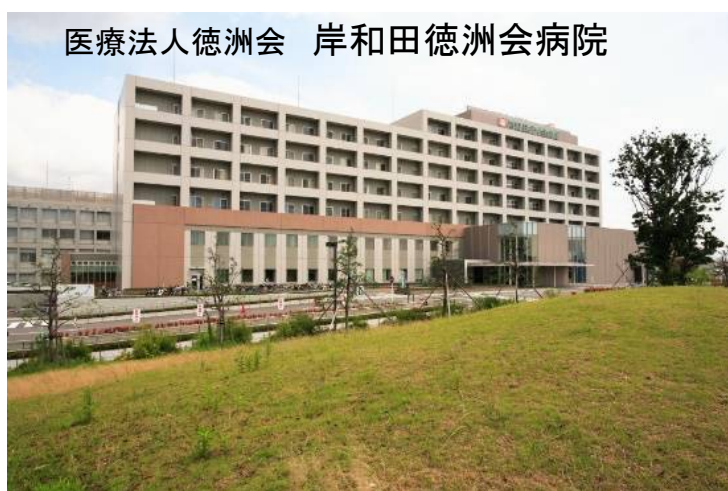
医療法人徳洲会 岸和田徳洲会病院

上記の日程でご都合がつかない場合は日程のご相談をさせていただきますのでご相談ください。